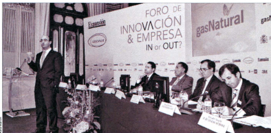
Participantes en la mesa de debate, que ofrecieron el punto de vista empresarial de la innovación.

este tipo de trabajo mejora la participación de la mano de obra en las empresas y aumentan el empleo".