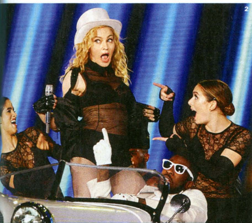
▲ MADONNU NEMÁM RÁD. „Ale to ještě neznamená, že jsem proti komerci v kultuře,“ říká Phelps.

nou recesi. Přitom by to dohromady stálo jen asi dvě stě miliard dolarů ročně. Místo toho se utratilo mnohem více peněz s mnohem menším efektem.