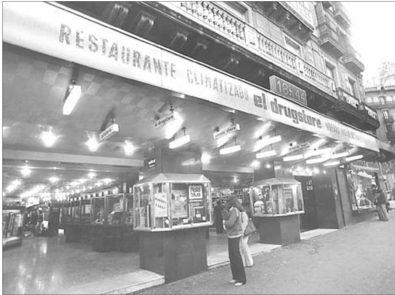
El Drugstore del paseo de Gràcia era una ciudad dentro de otra y de madrugada era la única ciudad.

Salió solo de Barcelona. Fabrizio del Dongo, el héroe de Stendhal, necesitó de la historia para saber que los matorrales y las explosiones lejanas de su juventud habían sido Waterloo. Trapiello tiene la literatura para saber que amó a una actriz y bebió absenta en el cuenco de sus manos, que caminó por la Barcelona de los tres pares y conoció allí la servil declinación de los artistas.