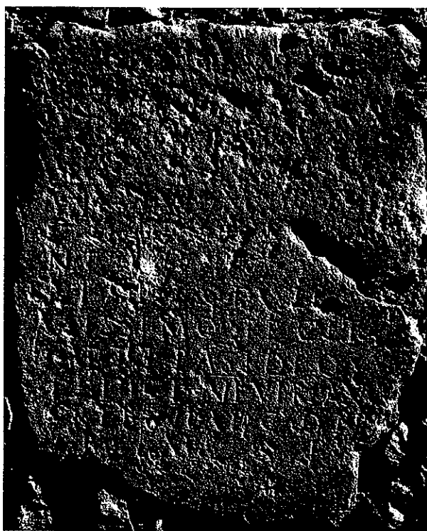
Fig. 1. L'iscrizione funeraria di Trebula Mutuesca