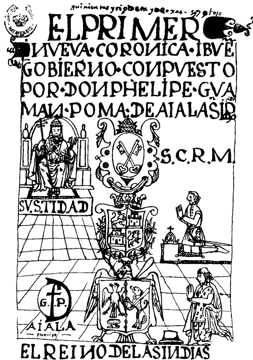
El primer Nueva Corónica y Buen Gobierno compuesto por don Felipe Guaman Poma de Ayala.

Sacra Católica Real Majestad / Su Santidad / [Monograma F.G.P.] / Ayala / príncipe / El reino de las Indias.