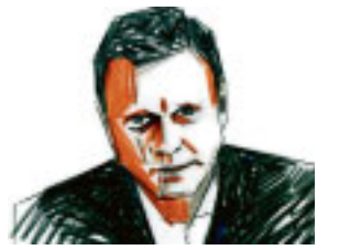
Von Georg M. Oswald

Es war spät. Der Termin hatte sich scheinbar endlos in die Länge gezogen. Im Licht der Straßenlaternen näherte sich Pfahl seinem Wagen. Mit leisem Bedauern stellte er fest, dass sein Fahrer ihn nicht empfing, wie er das früher getan hätte. Als Student hatte er angefangen, in der Fahrbereitschaft. Er hatte viele Chefs erlebt und verstanden, dass man antizipieren musste, um zum richtigen Zeitpunkt effektiv aus dem Wagen zu springen und die Tür aufzureißen. Leistung und ein gewisses Gespür dafür, was Führungskräfte hören und sehen wollen, hatten ihn dort hingebacht, wo er heute war. Überstunden, Wochenendarbeit, der besondere Einsatz, energisch und immer gut sichtbar. Hier aber stimmte ganz offensichtlich etwas nicht. Schmitt, sein Fahrer, saß nicht auf dem Fahrersitz. Erst auf den zweiten Blick entdeckte ihn Pfahl. Er saß im Fond. Pfahl öffnete die Hintertür.