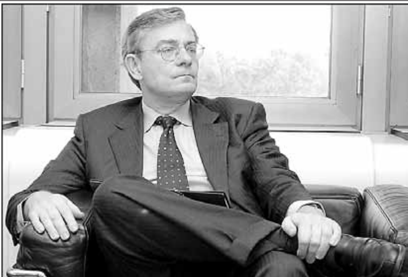
Jean Lemierre, president del BERD